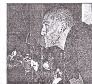
Martínez Cuarteto (España). 20:00. Aecid.