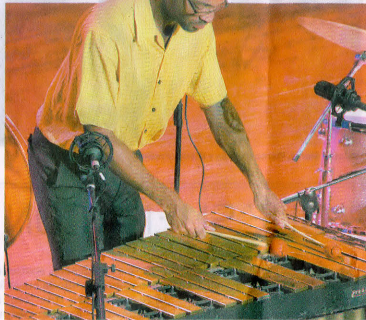
‘Offbeat personality’ es una propuesta de tiempos múltiples y notas dulces.