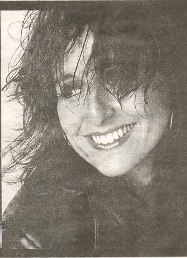
Los artistas que se presentan mañana en el CBA.

Cruz y La Paz, para luego continuar su gira por Ecuador, Venezuela y México.